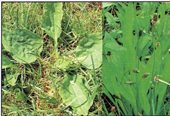
Plantain : Plantago