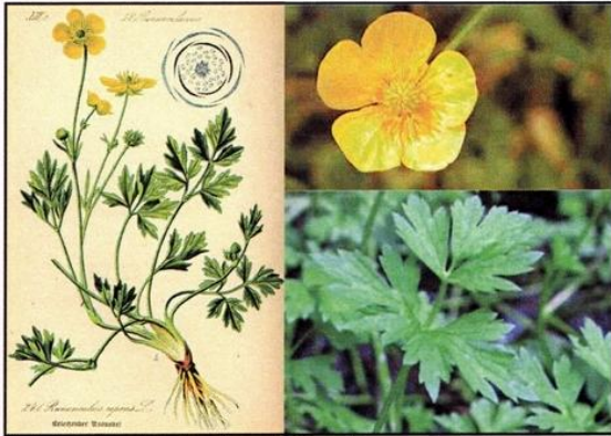
Bouton d'Or : Ranunculus

C'EST UNE PLANTE QUI COLONISE LES CULTURES, UNE PLANTE INDÉSIRABLE À L'ENDROIT OÙ ELLE POUSSÉ.