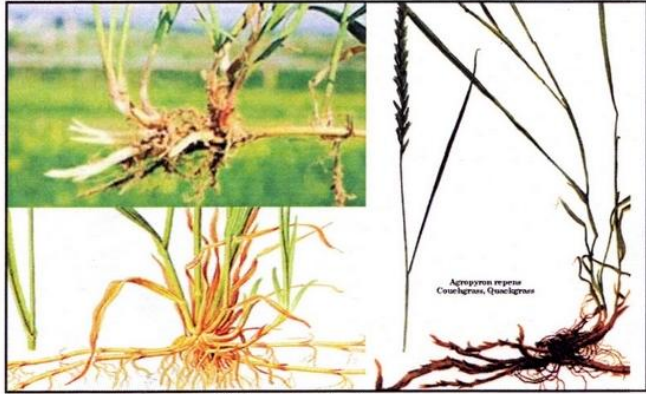
Chiendent : Agropyron