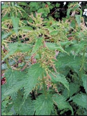
Ortie : Urtica