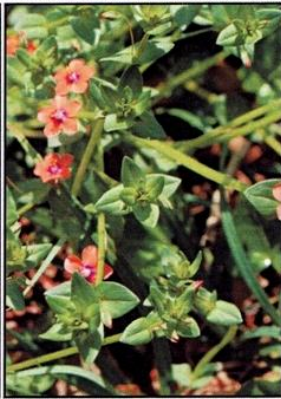
Mouron des champs : Anagallis