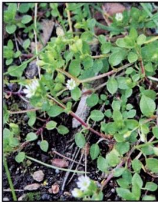
Mouron des oiseaux : Stellaria