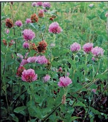
Trèfle des Champs : Trifolium