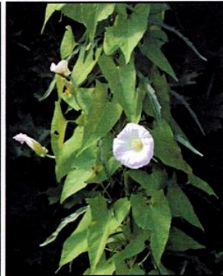
Liseron : Convolvulus