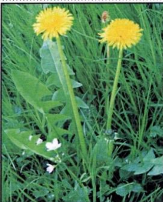
Pissenlit : Taraxacum