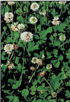
Trèfle rampant : Trifolium